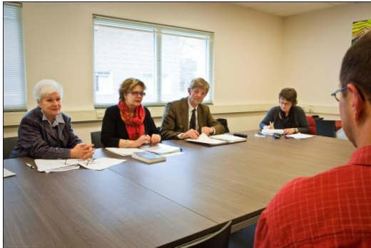
De Klachtencommissie van Trajectum

Wat zijn je rechten bij middelen en maatregelen?